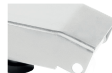
Kółka jezdne ułatwiające transport do miejsca użytkowania