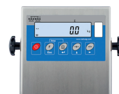
Miernik PUE C/31H z wyświetlaczem LCD w obudowie nierdzewnej