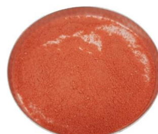
PRÓBKĄ PO ROZDROBNIENIU