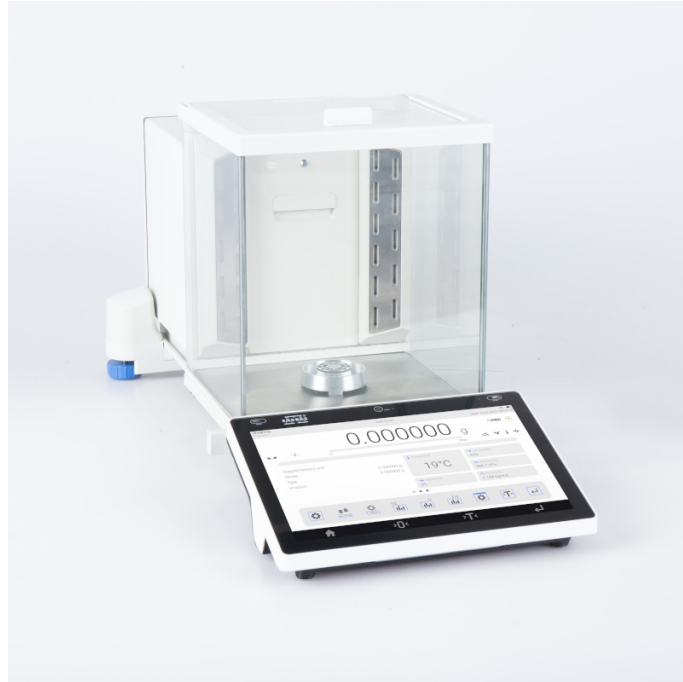
The drawings, photos and graphics used are for illustrative purposes only.