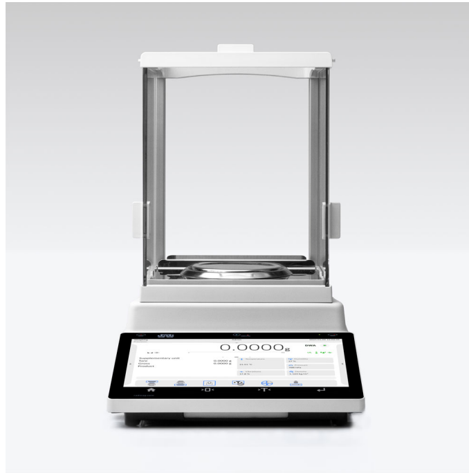
The drawings, photos and graphics used are for illustrative purposes only.

More information on the website radwag.com/es/info,w1,YAK