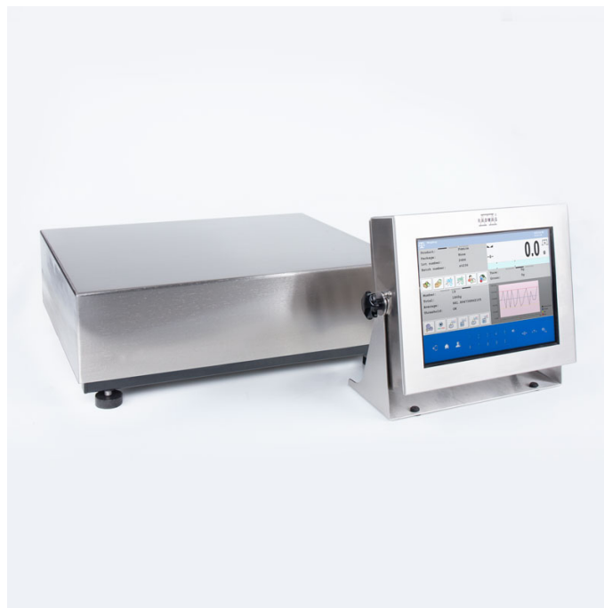
Użyte rysunki, zdjęcia, grafiki mają charakter poglądowy.