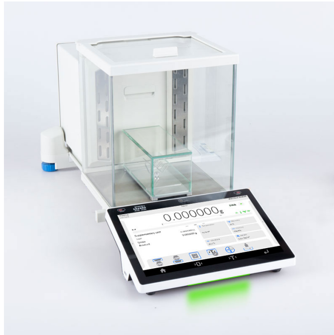
The drawings, photos and graphics used are for illustrative purposes only.

More information on the website radwag.com/it/info,w1,SSP