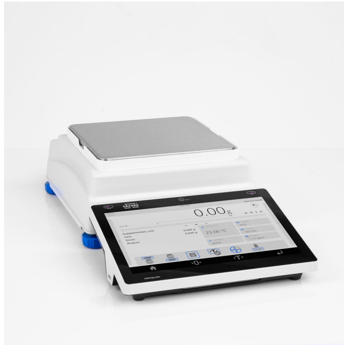
The drawings, photos and graphics used are for illustrative purposes only.