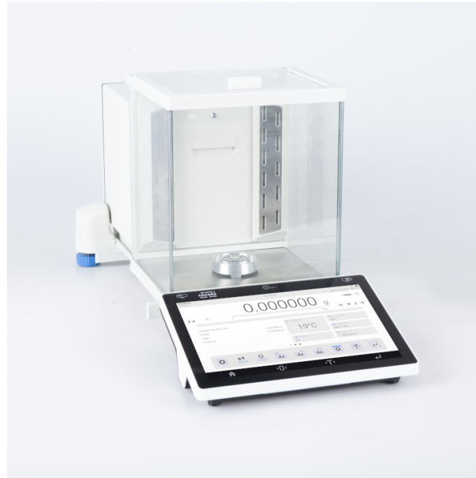
The drawings, photos and graphics used are for illustrative purposes only.