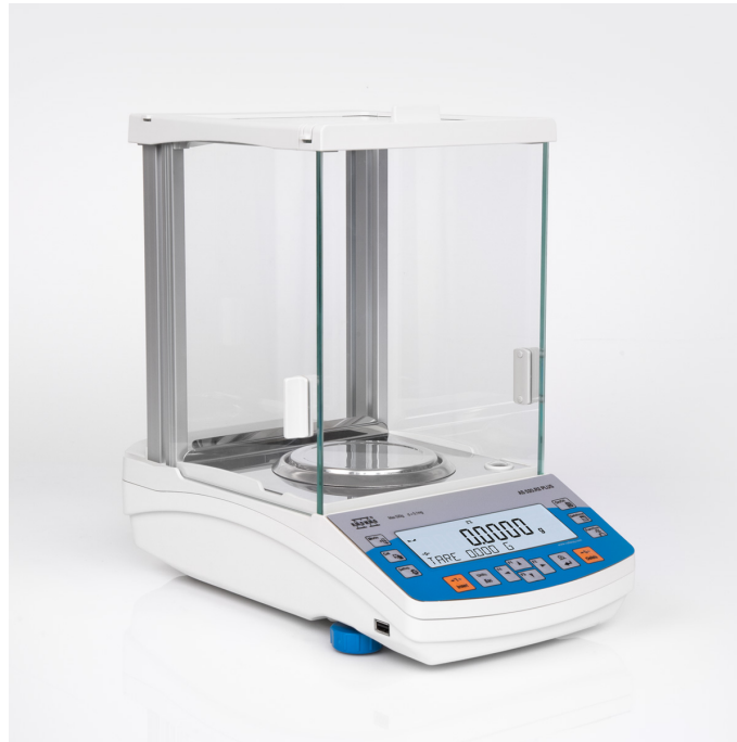
The drawings, photos and graphics used are for illustrative purposes only.