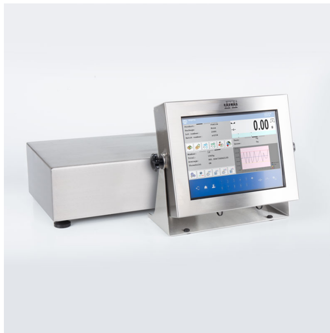
Użyte rysunki, zdjęcia, grafiki mają charakter poglądowy.