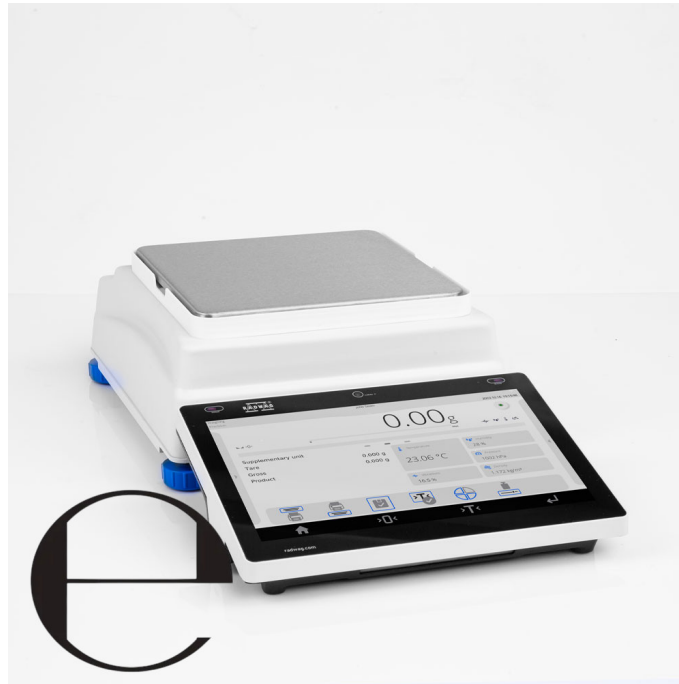
Użyte rysunki, zdjęcia, grafiki mają charakter poglądowy.