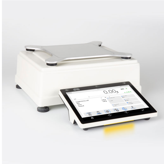
Użyte rysunki, zdjęcia, grafiki mają charakter poglądowy.