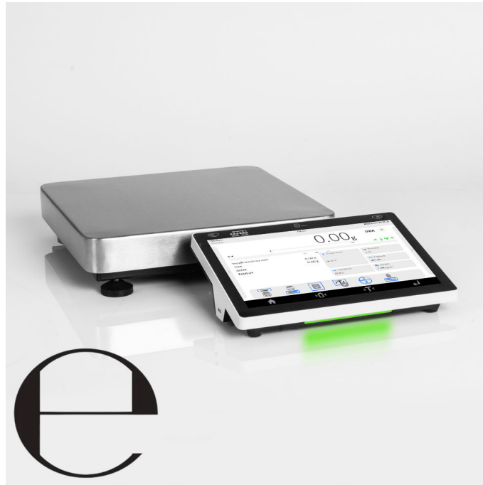
The drawings, photos and graphics used are for illustrative purposes only.