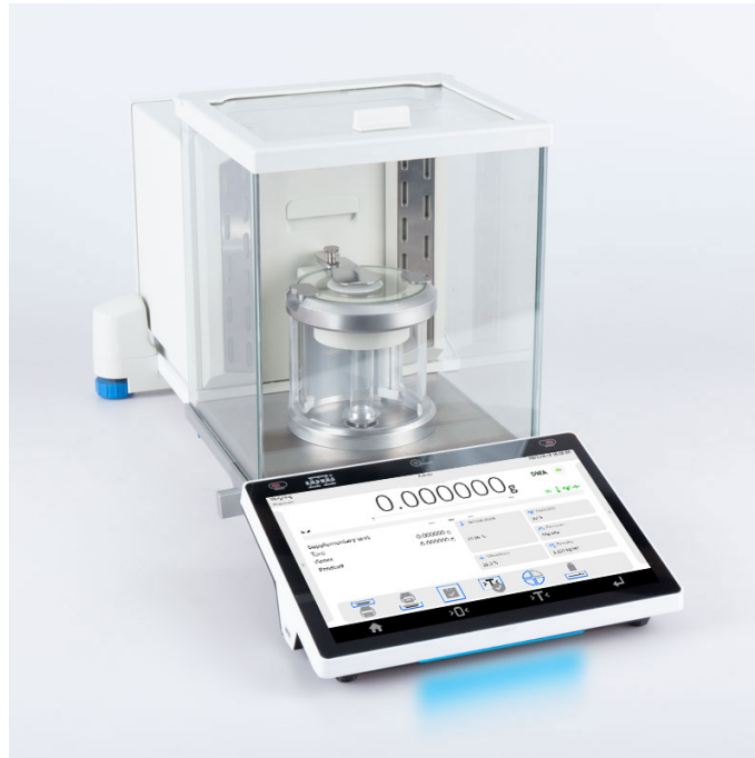
The drawings, photos and graphics used are for illustrative purposes only.

More information on the website radwag.com/es/info,w1,8PQ